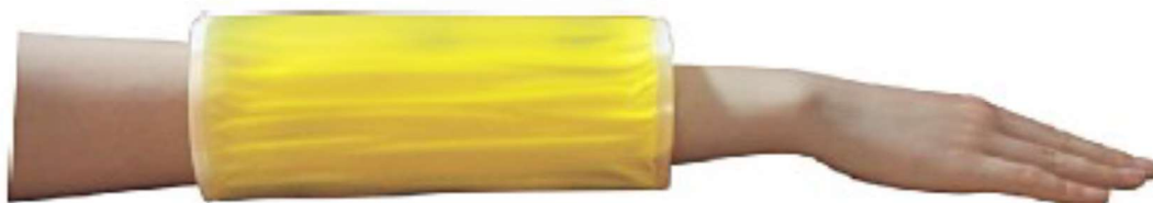
Positie voorarm SK-17-2 L46 x B21 x H0,8 cm SK-17-2-1 L38 x B11,5 x H0,8 cm