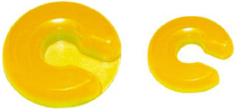
Positie Hoofd C SK-22-1 21 x H4,5 cm SK-22-1-1 15 x H3,5 cm