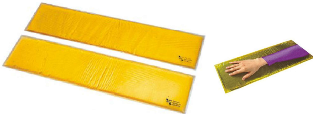
Positie arm SK-29 L55 x B15 x H1,3 cm