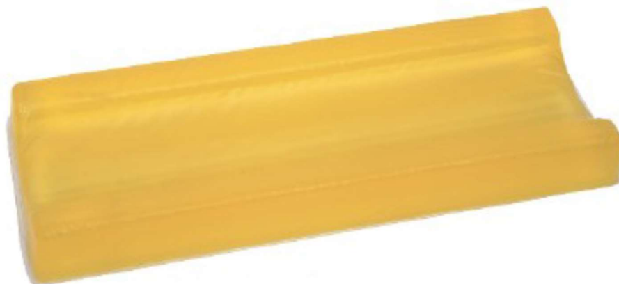
Positie arm lateraal SK-29-1 L41 x B15 x H5 cm SK-29-1a L55 x B15 x H6 cm