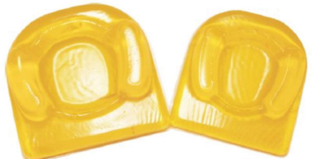
Positie : Hoofd zadelvorm SK-22-c L23 x B23 x H5,7 cm SK-22-d L19 x B21,6 x H3,8 cm