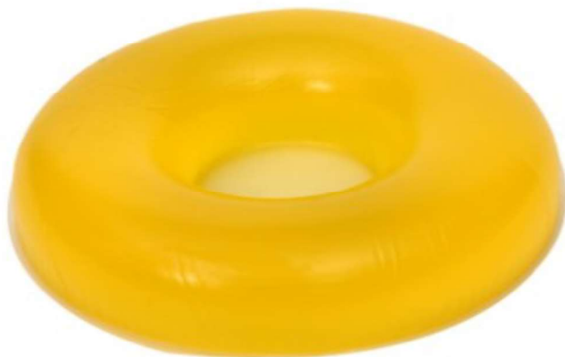
Positie Hoofd rond SK-22 20 x H4,5 cm SK-22-3 15 x H3,5 cm